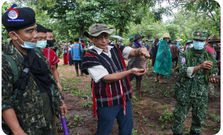
သုင်ပွဲပဲဟျီခိင် ပဒိင်မါဘးထံ သုင်သကိးသုင်ဒီးမိလဲတဖျိုင် ဝဲကီရိသုလုတော်သုင်သုင်မှီနံ ဝဲလါယူ ၁ သီ ၂၀၂၁ နံင်