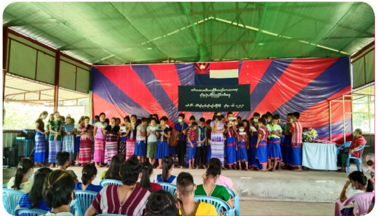
ချာ်လွံလျိုင်ကီရိရုင်မာလကပိ ကညီဒီကလုင်ကယူးကရမုင်နံယူထိုင် ၇၄ ဝိတံ ဝဲ လါယူထံ ၁၆ သီ ၂၀၂၁ နံင်