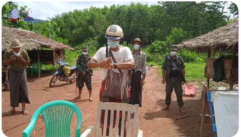
ခွဲခဲင်ပုည ချာ်လွံလျိုင်ကီရိရုင် ဆိထံကီရိဆုင် ဆိထိုင်တံဒိသဒါ မိဝဲ ၁၉ ကြိ